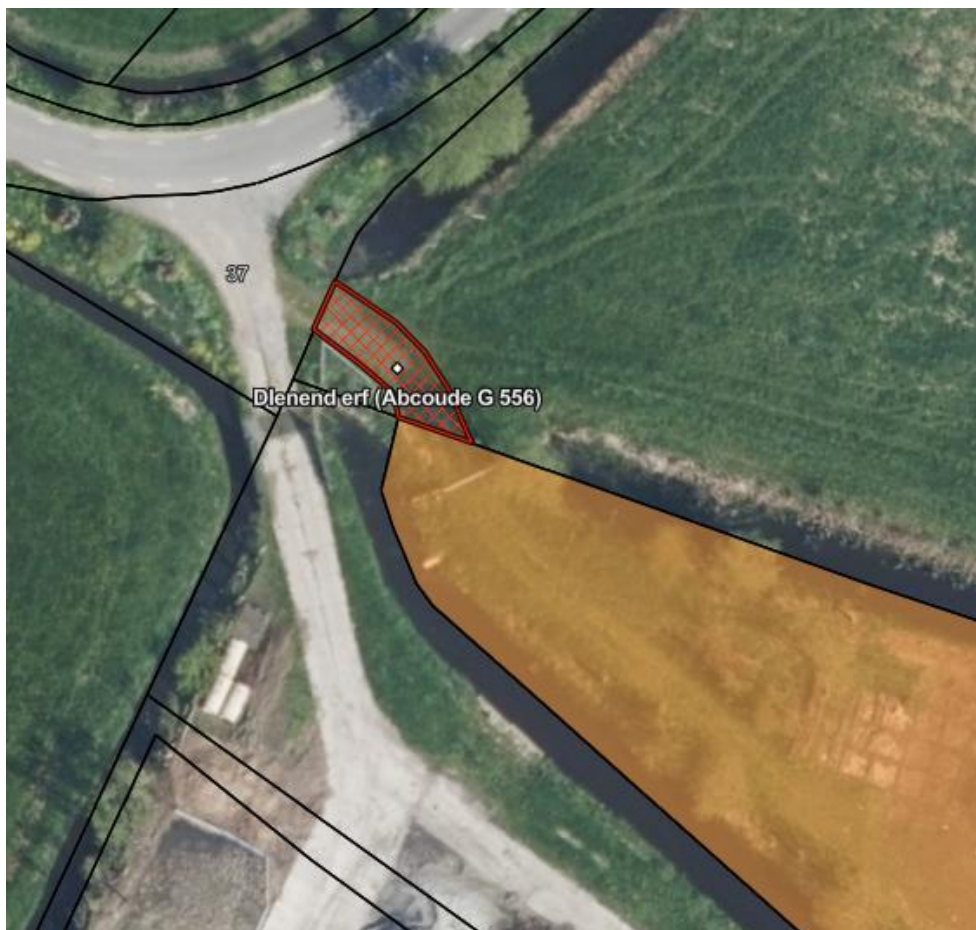
Figuur 3, erfdienstbaarheid

De percelen landbouwgrond zijn ontsloten middels een erfdienstbaarheid/ recht van weg over het naast liggende perceel (Abcoude G 556) om te komen en te gaan naar de openbare weg, genaamd Velterslaan, op thans bestaande wijze over het op dienende erf gelegen pad. Hierbij betreft het heersend erf kadastrale percelen Abcoude G 557, 558 en 560 (het verkochte) en het dienend erf het perceel Abcoude G 556 (in het rood gearceerd op onderstaand figuur 3). Voor letterlijke tekst zie eigendomsakte.