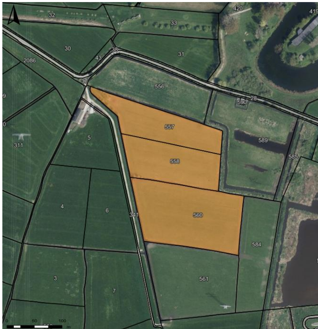
Figuur 1, Landbouwgrond Velterlaan Abcoude

GELEGEN OM EN NABIJ Velterslaan te Abcoude =====